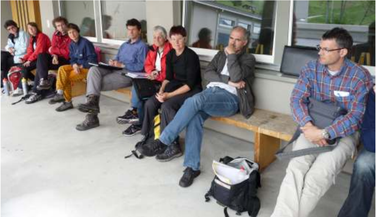
Das OK ist müde von der Sitzung