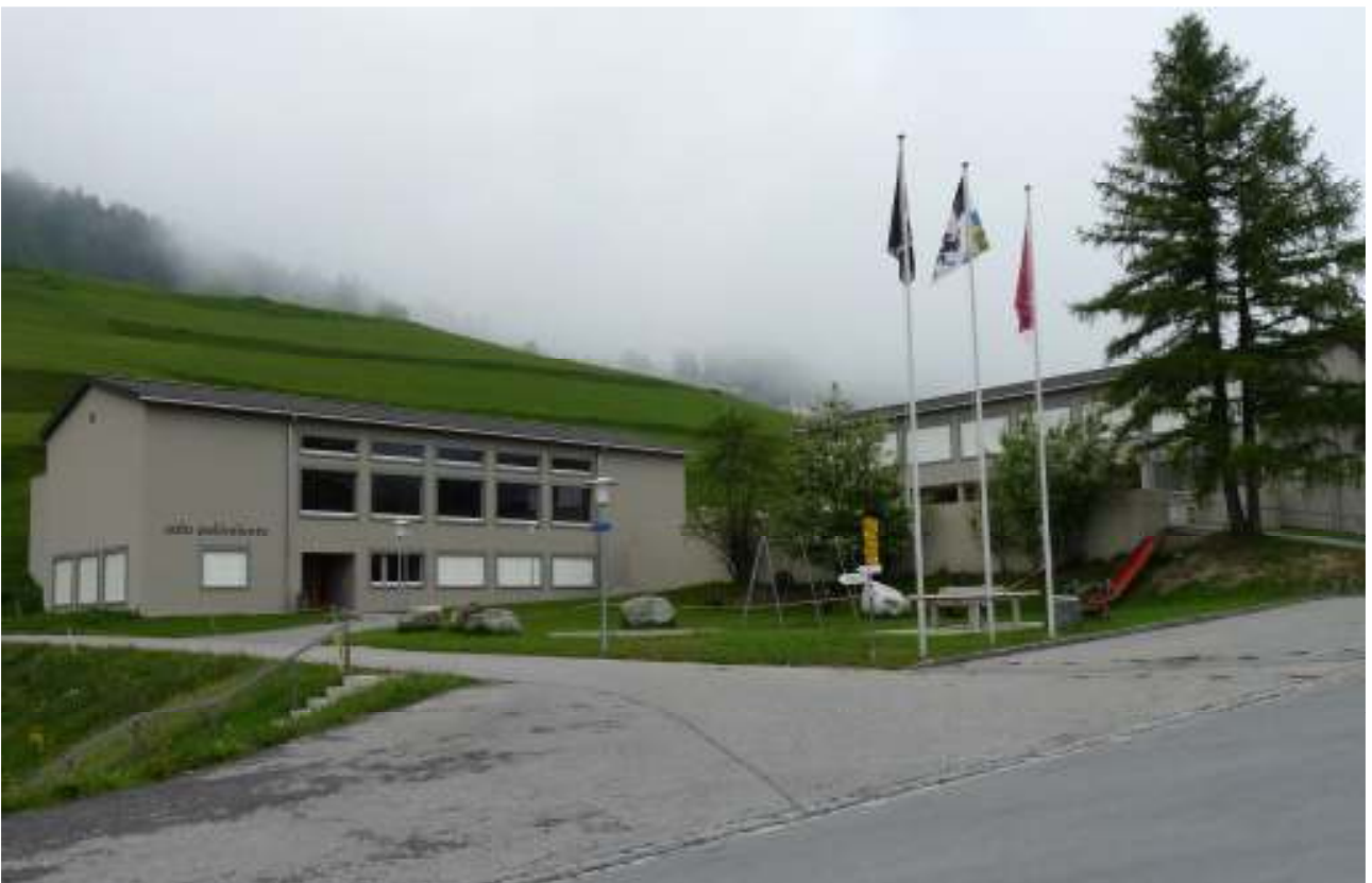
Am 21./22. August wird das Schulhaus in Salouf nicht mehr so einsam sein...