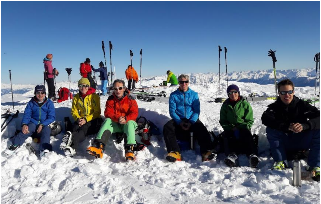
OLG-Chur-Skitour, 14. Januar 2018, Piz Beverin