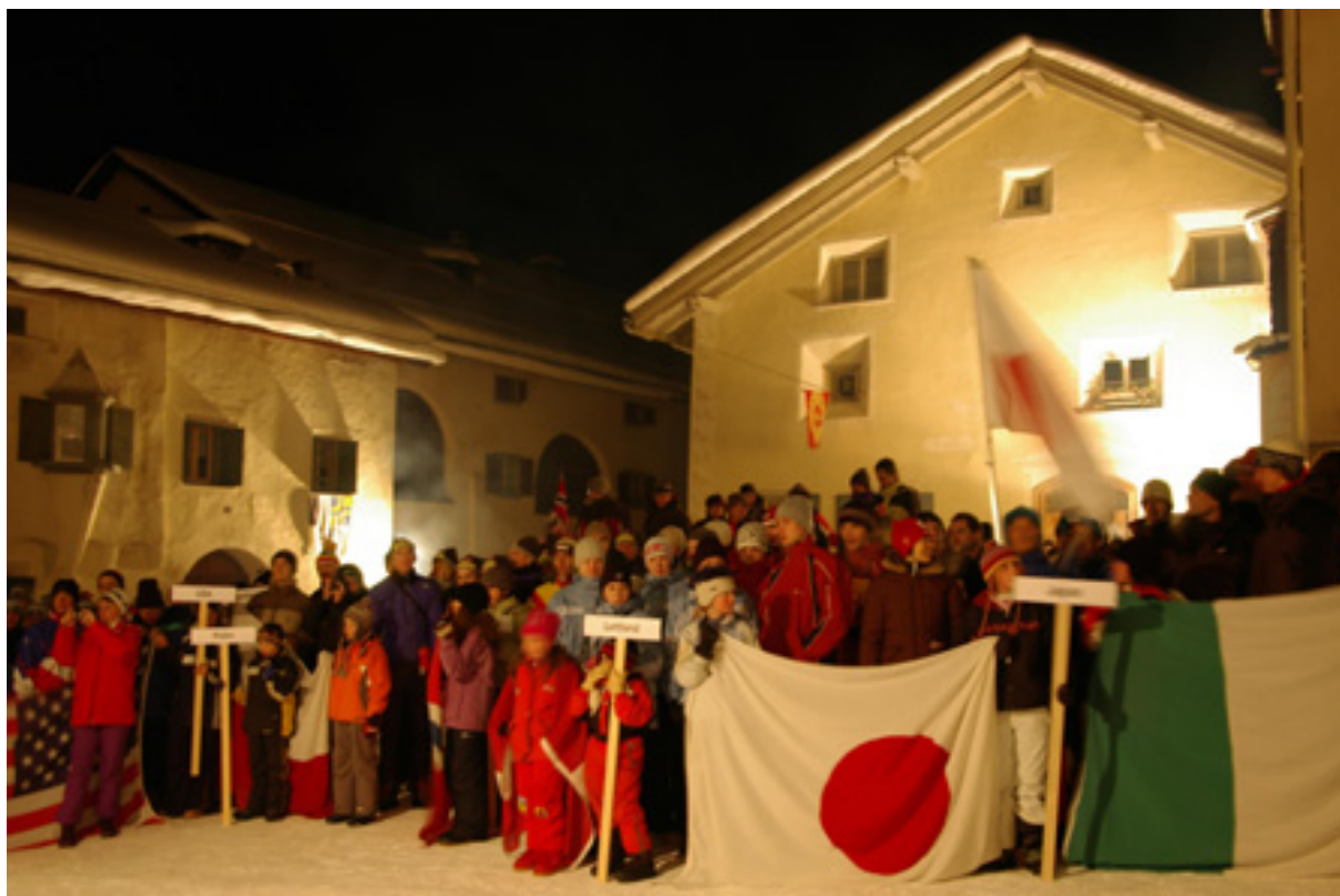
Eröffnungsfeier an der Junioren-WM 2005 in S-chanf

Helfer und HelferInnen werden weiterhin gesucht! Besten Dank allen die sich bereits gemeldet haben. Kontaktperson: Hansruedi Häny