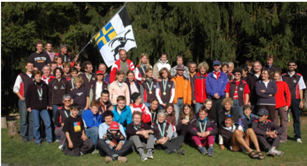
Noch feiert das Team Graubünden seinen Sieg am Arge Alp...