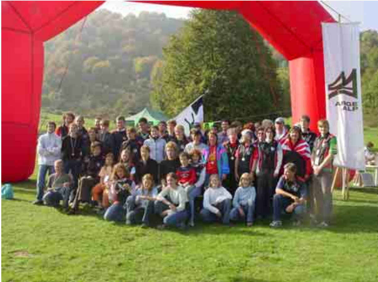
Bündner Arge Alp Team in der Lombardei