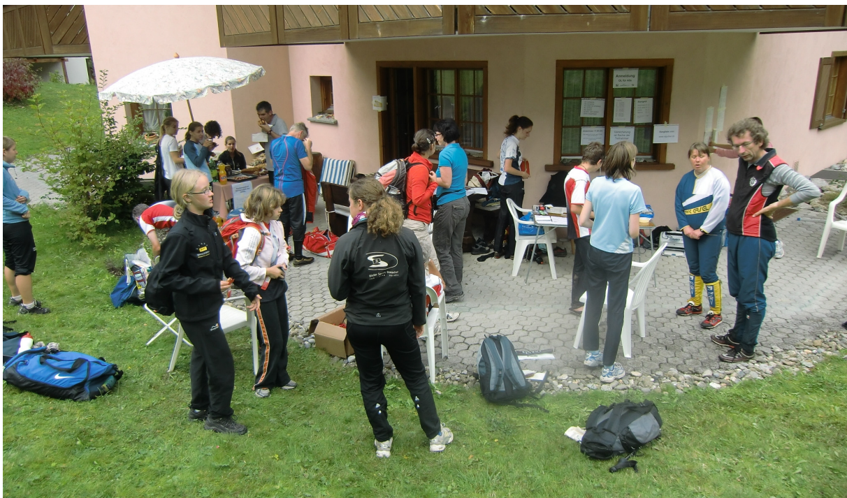
Wettkampfbereich in Trudis Garten beim OL für alle in Parpan