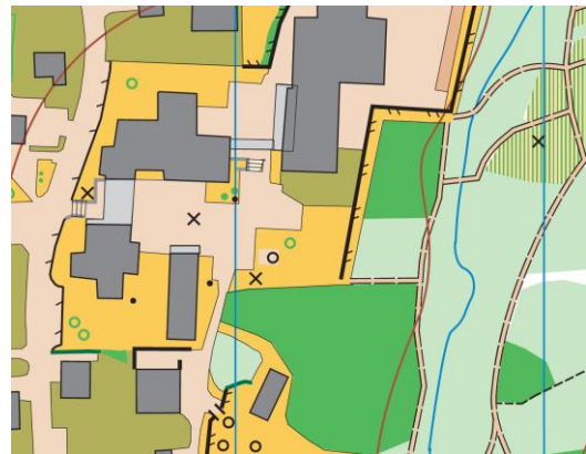
Ausschnitt Karte Ilanz (Schulhaus)

(Für aktuelle Updates bitte Homepage und Chalchofa-Mail beachten)